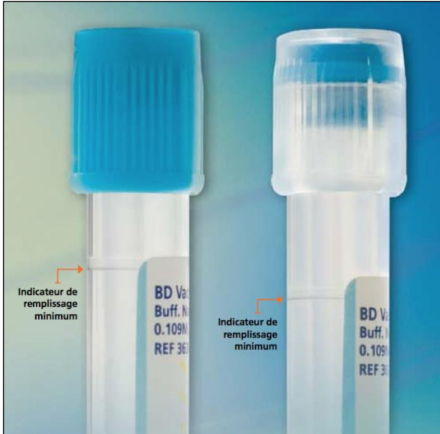
Indicateur de remplissage minimum (90%) pour les tubes citratés utilisés en hémostase = limite d'acceptabilité